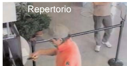
Repertorio tori si sono fatti consegnare il denaro

Nella giornata di ieri, nella filiale della Banca Intesa sita in località Casavitola a Boville Ernica , sono entrati tre individui con il volto travisato. I tre armati di taglierino hanno minacciato gli impiegati e i clienti che si trovavano all'interno dell'istituto di credito in quel momento. I rapina-