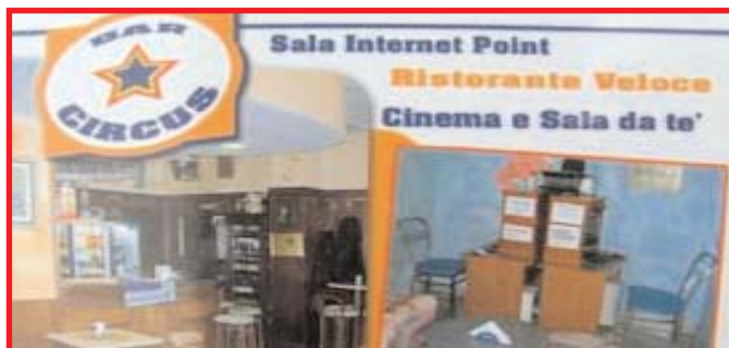
Via D'Annunzio CASSINO - TEL. 0776 310259

Via D'Annunzio, 32 - Cassino Tel. 0776 313889